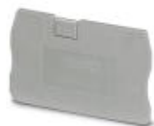
Abschlussdeckel, Länge: 48,6 mm, Breite: 2,2 mm, Höhe: 29,1 mm, Farbe: grau