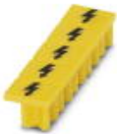
Warnabdeckung, 5-polig, für Klemmenbreite: 5,2 mm