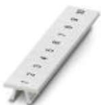
Zackband, Streifen, weiß, beschriftet, längs bedruckt: fortlaufende Zahlen 1-10, 11-20 usw. bis 491-500, Montageart: verrasten in hoher Schildchennut, für Klemmenbreite: 5,2 mm, Schriftfeldgröße: 5,15 x 10,5 mm

Zackband - ZB 5,LGS:FORTL.ZAHLEN - 1050017