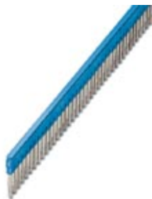
Steckbrücke, Rastermaß: 6,2 mm, Breite: 308,3 mm, Polzahl: 50, Farbe: blau

Bitte beachten Sie, dass die hier angegebenen Daten dem Online-Katalog entnommen sind. Die vollständigen Informationen und Daten entnehmen Sie bitte der Anwenderdokumentation. Es gelten die Allgemeinen Nutzungsbedingungen für Internet-Downloads. ( http://phoenixcontact.de/download )