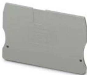
Abschlussdeckel, Länge: 71,5 mm, Breite: 2,2 mm, Höhe: 49,9 mm, Farbe: grau

Bitte beachten Sie, dass die hier angegebenen Daten dem Online-Katalog entnommen sind. Die vollständigen Informationen und Daten entnehmen Sie bitte der Anwenderdokumentation. Es gelten die Allgemeinen Nutzungsbedingungen für Internet-Downloads. ( http://phoenixcontact.de/download )