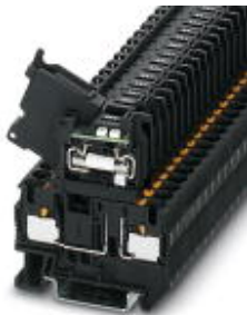
Hebelsicherungsklemme, Farbe schwarz, für 5 x 20 mm G-Sicherungseinsätze, mit LED für 24 V DC

Bitte beachten Sie, dass die hier angegebenen Daten dem Online-Katalog entnommen sind. Die vollständigen Informationen und Daten entnehmen Sie bitte der Anwenderdokumentation. Es gelten die Allgemeinen Nutzungsbedingungen für Internet-Downloads. ( http://phoenixcontact.de/download )