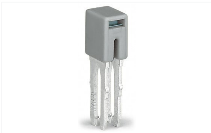
Farbe: ■ grau